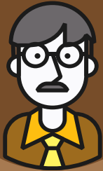
เบบี้บูมเมอร์ พ.ศ. 2489 - 2507

หรือวัยเกษียณ ในวัยนี้ ส่วนใหญ่จะไม่ค่อยมีรายได้จากงานประจำแล้ว ดังนั้นจึงค่อนข้างระมัดระวังในการใช้เงิน สำหรับบางคนอาจจะเก็บเงินก้อนสุดท้ายที่เหลืออยู่ การจัดพอร์ตจึงควรเป็นแบบระมัดระวัง เป้าหมายก็คือชนะเงินเฟ้อ แต่ไม่หวังหวาหรือผันผวนมากนัก พอร์ตที่แนะนำคือเป็นพอร์ตกองทุนรวมตราสารหนี้ กองทุนรวมตราสารหนี้รวมกันประมาณ 70-90% โดยจะลงทุนในกองทุนรวมตราสารหนี้หรือตราสารหนี้เท่านั้น ขึ้นอยู่กับความต้องการใช้เงินและรายจ่ายที่จำเป็น ในส่วนของกองทุนรวมตราสารหนี้หรือหุ้นนั้น ควรลงทุนอยู่ในสัดส่วนประมาณ 10-30% เท่านั้น และไม่ควรถูกลงทุนในกองทุนต่างประเทศที่ไม่มีการป้องกันความเสี่ยงของค่าเงิน