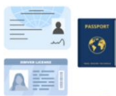
1.หลักฐานแสดงตน